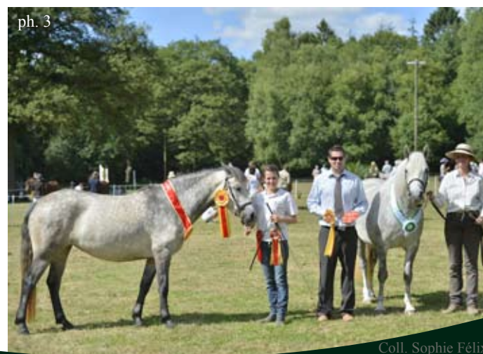
Coll. Sophie Félix Coll. Hubert Laurent

CHAMPIONNE TOUTES RACES 2013 : VAL D'ISA MELODY