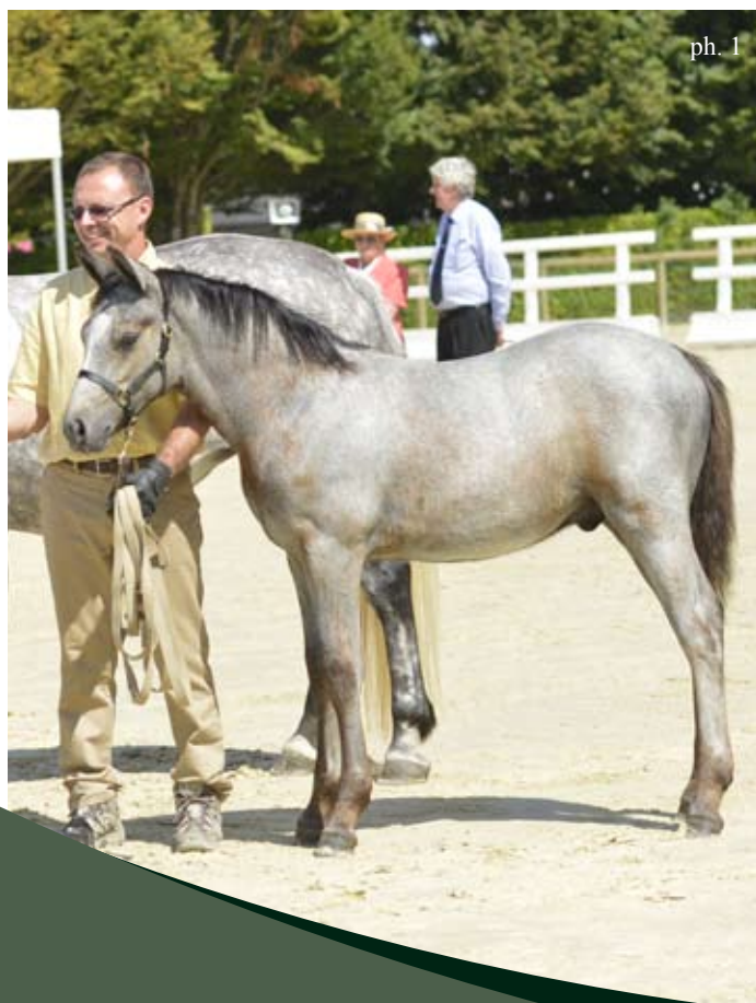
1 - Dia de Seguret