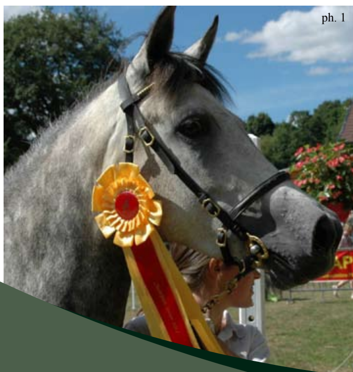
1 & 2 - Val d'Isal Mélody